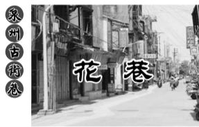
泉州子城中山路左侧(承天巷对面),有一条东西走向的街巷,连接许厝埕、新路埕、直通新华路,现在许多人把它统称为“花巷”。

泉州子城有四门,南门曰“崇阳”(曾改祿蒸),此巷在其西侧。唐宋时期,崇阳门以西并无花巷之名。元代,崇阳门下有重兵把守,西侧有官屋,供屯驻军兵居住,他们大部是蒙古人和色目人,时人就