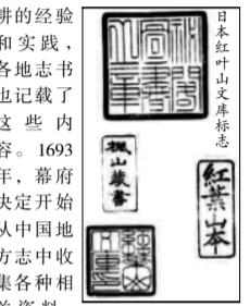
日本红叶山文库藏书

泉州子城有四门,南门曰“崇阳”(曾改祿蒸),此巷在其西侧。唐宋时期,崇阳门以西并无花巷之名。元代,崇阳门下有重兵把守,西侧有官屋,供屯驻军兵居住,他们大部是蒙古人和色目人,时人就