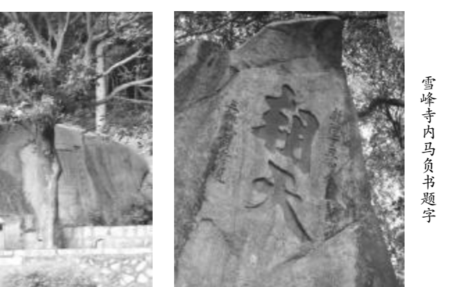
雪峰寺内马负书题字