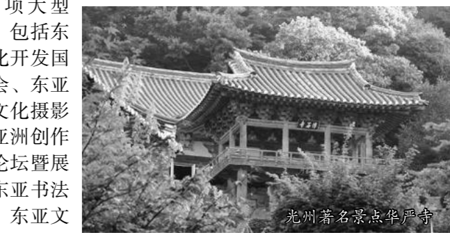
光州著名景点华严寺

化都市探访、光州国际艺术双年展20周年特别展等等。光州十分关注“东亚文化之都”活动的长期效应。据介绍，2015年，光州将建成国立亚洲文化殿堂，为亚洲各国艺术家的创作活动、论坛和学术研讨会提供支持，促进亚洲各国文化领域的人才交流，建设引领亚洲文化发展方向的代表城市；并且要在5年到10年内坚持举办文化活动，不断提升光州的文化影响力。