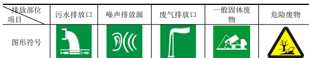
表 5-2 厂区排污口图形符号（提示标志）一览表

规范化排放口：排放口应预留监测口做到便于采样和测定流量，并设立标志（有要求监控的项目应论述）。执行《环境图形标准排污口(源)》(GB15563.1-1995)及《环境保护图形标志-固体废物贮存(处置)场》(GB15562.2-1995)及其2023年修改单要求。见表5-2，标志牌应设在与之功能相应的醒目处，并保持清晰、完整。